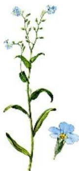
г) Незабудка болотная