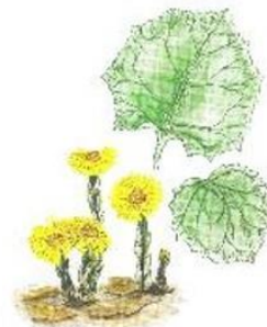
в) Мать-и-мачеха обыкновенная