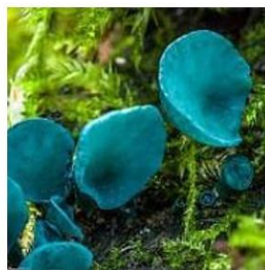
д) гриб хлороспелениум сине-зелёный