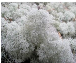
б) лишайник ягель (виды родов кладина и кладония)