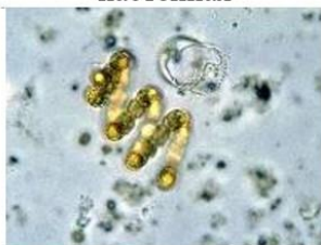
г) цианобактерии (устаревшее название – синезелёные водоросли)