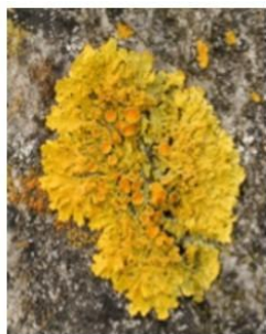
а) лишайник ксантория настенная

Среди представленных организмов выберите те, которые выполняют в экосистеме роль продуцентов.