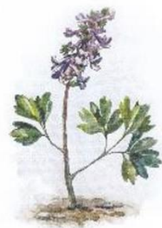
е) Хохлатка плотная