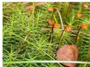
в) зелёный мох кукушкин лён