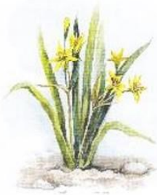
б) Гусиный лук, или Гейджия