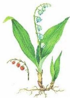
а) Ландыш майский

Весеннецветущие растения, или первоцветы – это многолетние травянистые растения с непродолжительным периодом цветения. Выберите первоцвет, у которого в распространении семян участвуют муравьи. Данный вид занесён в Красную книгу города Москвы.