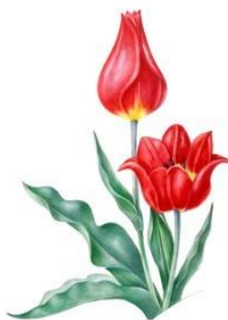
д) Тюльпан Шренка